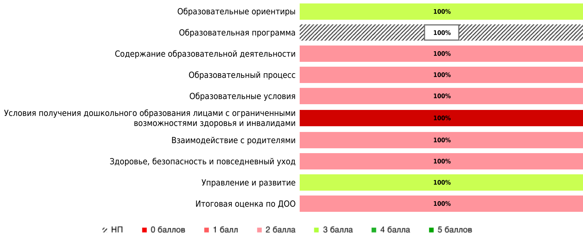
Доли ДОО с разными баллами у их ООП ДО ДОО (самооценка)

В процессе самооценки было оценено 1 ООП ДО ДОО из 1 ДОО субъекта РФ.